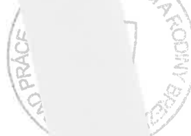
Ing. J. n riaditeľ U zno